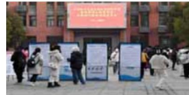
基层就业的鼓励政策,进一步充实基层人才队伍。

众所周知,城市公务员的热门岗位竞争激烈,通常都有学历、专业、户籍等报考限制,而乡镇基层公务员的“三不限”岗位,即学历(至少大专)、专业、户籍不受限制,不只是专科生,往届生也可以报考。